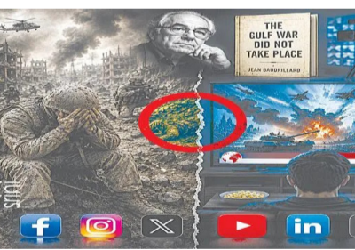
యుద్ధం ముందే గెలిచిన పందెం. ఇది కేవలం ప్రచ్ఛన్న యుద్ధ తర్వాతి కాలంలో అమెరికా తన ఆధిపత్యాన్ని చాటుకోవడానికి, ప్రదర్శించడానికి మాత్రమే ఉపయోగపడింది. బోద్రియో ఉద్దేశంలో నేడు మీడియా, సోషల్ మీడియాలో కృత్రిమ ప్రతిరూపాలు లేదా భ్రమలు ఎటువంటి మూలాధారం లేకుండానే స్వతంత్రంగా పుట్టుకొస్తున్నాయి. ఈ నకళ్లు ఎంత శక్తిమంతంగా మారాయంటే, అసలైన వాస్తవం కంటే ముందు ఇవే సమాజంలో ప్రచారంలోకి వస్తున్నాయి. కాలక్రమేణా అసలు వాస్తవాన్ని పూర్తిగా రూపుమాపి తామే నిజమైన వాస్తవంగా చలామణి అవుతున్నాయి. దీనినే బోద్రియో హైపర్ రియాలిటీ (నిజం కంటే ఎక్కువ నిజంలా అనిపించడం) అన్నారు. ఎంపిక చేసిన దృశ్యాలు ద్వారా ప్రపంచ ప్రేక్షకులు ఒక వర్చువల్ థియేటర్లో భాగస్వాములవుతున్నారని, దీనివల్ల యుద్ధం కలిగించే నిజమైన మానవతా విధ్వంసాన్ని పాశ్చాత్య గుర్తించలేకపోతున్నారని బోద్రియో అంటాడు. బోద్రియో సిద్ధాంతం వర్తమాన అంతర్జాతీయ సంక్షోభానికి, యుద్ధానికి స్పష్టంగా వర్తిస్తుంది. 1991 నాటి గల్ఫ్ యుద్ధం లాగే, ఈ యుద్ధం కూడా ఒక హైటెక్ మీడియా ప్రదర్శన. మీడియా, సోషల్ మీడియా ద్వారా డ్రోన్ ఫుటేజీ, లైవ్ స్ట్రీమ్ మీడియాలు, క్లిపి నిరోధక యూనికాట్ వంటివి సృష్టించి, అల్టాధిమిక్ సూప్ ఫీడ్స్,

ఒకవైపు అత్యంత దారుణమైన దాడులు జరుగుతున్నట్లు దృశ్య రూపంలో వార్తలు వస్తుండగానే, మరోవైపు అంతే వేగంగా అంతర్జాతీయ ఒప్పందాలు, చర్చలు తెరవెనక జరిగి పోతుంటాయి. ఈ గుండరగళంలో ఏది నిజమైన వ్యూహమో, ఏది కేవలం ప్రపంచాన్ని భ్రమల్లో ఉంచడానికి ఆడుతున్న నాటకమో గుర్తించడం సామాన్యుడికి అసాధ్యంగా మారుతోంది. 2018-2020 మధ్య కాలంలో ట్రంప్ ప్రసంగాలు, ఇరాన్ పట్ల ఆయన అవలంబించిన విధానాలను బోద్రియో సిద్ధాంతాల కోణంలో పరిశీలిస్తే ఆసక్తికరమైన విషయాలు వ్యక్తమవుతాయి. అణ్వాయుధ ఒప్పందం (జీజూర్) నుంచి అమెరికా వైదొలగడం, ఇరాన్ పై గరిష్ట స్థాయి ఆంక్షలు విధించడం, 2020లో ఖాసిం నల్ మహనీని హతమార్చడం వంటి కీలక ఘటనావళిని బోద్రియో చెప్పే మీడియా తంత్రం, భ్రమల (సిమ్యూలేషన్) కోణంలో చూడవచ్చు. నల్ మహనీ వల్ల ముంచుకొస్తున్న ముప్పును అడ్డుకున్నామనో లేదా దేశానికి లభించిన ఘన విజయాలనో ట్రంప్ తన డ్విట్టు, ట్విట్టర్ ద్వారా నాటకీయంగా ప్రచారం చేసేవాడు. బోద్రియో దృష్టిలో ఇప్పటి క్షేత్రస్థాయి నిజాలతో సంబంధం లేకుండా స్వతంత్రంగా చలామణి అయ్యే ఒక కృత్రిమ వాస్తవికత నృప్తి మాత్రమే. ట్రంప్ శైలి, తప్పుడు వార్తల చుట్టూ సాగిన ఆయన ప్రవర్తన వాస్తవాల కంటే మీడియా సృష్టించిన ప్రతిబింబాలకు ఎక్కువ దగ్గరగా ఉంటాయి. బోద్రియో పరిభాషలో చెప్పాలంటే, యుద్ధం లేదా దానిని నివారించడం అనేది క్షేత్రస్థాయి వాస్తవికతగా కంటే కేవలం ఒక మీడియా ఈవెంటాగా మారిపోయింది.