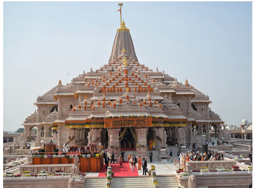
విషయం గుర్తుంచుకోవాలి. ప్రజాస్వామ్యంలో ఆరోపణలు, అనుమానాలు, రాజకీయ వ్యాఖ్యలు ఒకటి; నిరూపితమైన వాస్తవాలు మరొకటి. ప్రతిపక్ష నాయకులు ఈ అంశాన్ని తీవ్రంగా విమర్శిస్తున్నారు. కొందరు దీనిని హిందూ సమాజానికి జరిగిన మోసంగా అభివర్ణిస్తుండగా, మరొకొందరు ప్రభుత్వ పర్యవేక్షణ వైఫల్యంగా చిత్రికరిస్తున్నారు. కానీ రాజకీయ విమర్శలతోనే సత్యం తేలిపోదు. అదే సమయంలో అధికారిక ప్రకటనలతోనే ప్రజల అనుమానాలు కూడా తొలగిపోవు. దేశీయ, అంతర్జాతీయ మీడియా ఈ వ్యవహారాన్ని కేవలం దొంగతనం కేసుగా కాకుండా “పారదర్శకత సంక్షోభం”గా చూస్తోంది. ఎందుకంటే అయోధ్య రామమందిరం ప్రపంచవ్యాప్తంగా గుర్తింపు పొందిన మత వరమైన ప్రాజెక్టు. కోట్లాది

నడిచే సంస్థలు ప్రజా విశ్వాసాన్ని పొందుతున్నప్పుడు, వాటి జవాబుదారీతనం కూడా అంతే స్థాయిలో ఉండాలి. రామమందిరం వంటి అత్యంత ప్రతిష్టాత్మక సంస్థ విషయంలో ఈ ప్రమాణాలు మరింత కఠినంగా ఉండాలి. ఎందుకంటే ఇది కేవలం ఒక మత సంస్థ మాత్రమే కాదు; దేశ రాజకీయాలు, సంస్కృతి, చరిత్ర, సామాజిక భావోద్వేగాలతో ముడిపడి ఉన్న చిహ్నం. అందువల్ల చిన్న లోపం కూడా పెద్ద సంక్షోభంగా మారుతుంది. ఈ వివాదంలో అత్యంత బాధాకరమైన అంశం ఏమిటంటే, భక్తులు సమర్పించిన ప్రతి రూపాయి వెనుక ఒక విశ్వాసం ఉంటుంది. కొందరు తమ సంపాదనలో భాగం ఇస్తారు. కొందరు జీవితకాల పాదుపులను సమర్పిస్తారు. మరొకొందరు భక్తి భావంతో బంగారం, వెండి, ఆభరణాలు అందిస్తారు. అలాంటి విరాళాల నిర్వహణలో అవకాశాల అరోపణలు రావడం ఆర్థిక నష్టానికి మించిన నైతిక నష్టం. కాబట్టి ఈ వ్యవహారంలో అసలు అవసరం రాజకీయ ఆరోపణలు కాదు, సంపూర్ణ సత్యావిష్కరణ. అరెస్టులను వ్యక్తులు మాత్రమే బాధ్యులు? లేక పర్యవేక్షణలో ఉన్నతస్థాయి వైఫల్యాలు కూడా ఉన్నాయా? భద్రతా వ్యవస్థలు ఎందుకు విఫలమయ్యాయి? సీసీటీవీ పర్యవేక్షణలో లోపాలు ఎలా వచ్చాయి? బాధ్యత ఎక్కడ ఆగుతుంది? ఈ ప్రశ్నలకు స్పష్టమైన సమాధానాలు రావాలి. రామమీద మీద నిర్భయమైన ఆలయంలో జరిగిన ఈ వివాదం చివరకు ఒకే సందేశాన్ని ఇస్తోంది. విశ్వాసం సంపాదించడం కష్టం; కోల్పోవడం చాలా సులభం. భక్తుల విశ్వాసాన్ని కాపాడాలంటే న్యాయం జరిగిందని చెప్పడం సరిపోదు. న్యాయం జరిగిందని ప్రజలకు అనిపించాలి. అదే అయోధ్యకు, అదే రామమందిరానికి, అదే భారత ప్రజాస్వామ్యానికి ఇప్పుడు ఉన్న అతిపెద్ద పరీక్ష.