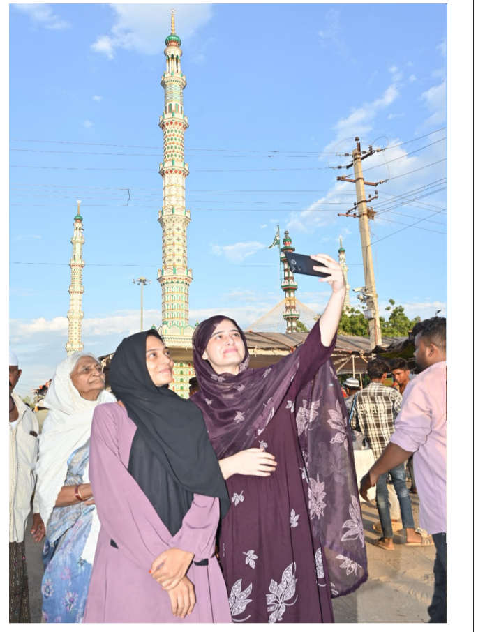
భక్తి, బంధం, ఆనందం... బారా షహీద్ దర్గా ప్రాంగణంలో ఒక అందమైన క్షణం. స్వర్ణాల చెరువు తీరాన కోర్కెలను రొట్టెలను వదిలి... ఆనందాన్ని నెట్టిలో దాచుకున్న ఆకావెల్లెలు